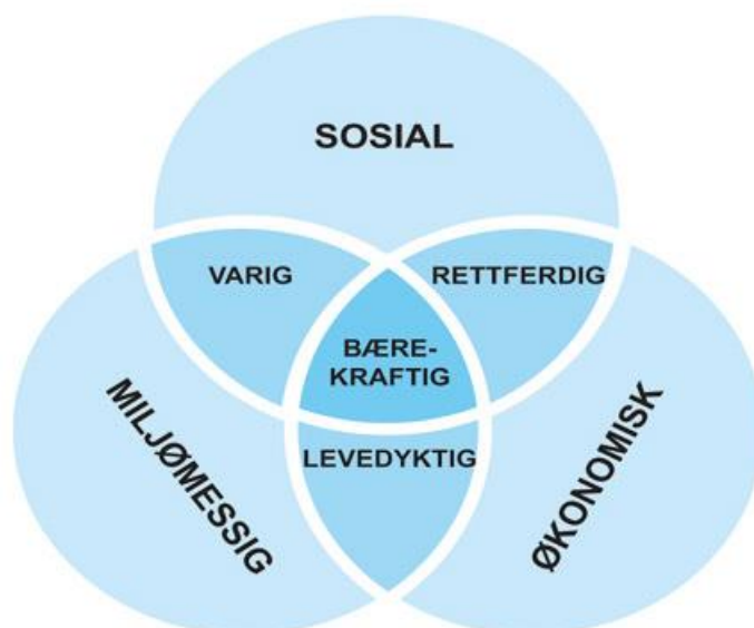
Figur 1 - FNs modell for bærekraftig utvikling

Regjeringen har bestemt at FNs 17 bærekraftsmål, som Norge har sluttet seg til, skal være det politiske hovedsporet for å ta tak i vår tids største utfordringer.