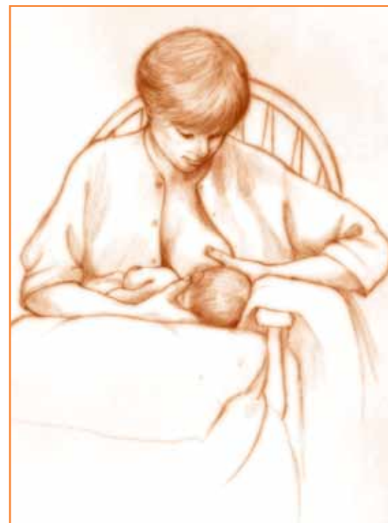
Sittende 2: Mor støtter barnets rygg og nakke med sin hånd og underarm. Barnets nakke skal kun støttes forsiktig, ikke presses mot mor. På den måten kan moren raskt trekke barnet mot seg når det gaper. Samtidig kan moren støtte og eventuelt forme brystet med den andre hånden. Denne stillingen er gunstig ved amming av sugesvake og premature barn, ved store bryst for å gi støtte, eller når det er behov for å forme brystet slik at det passer bedre til barnets gap.