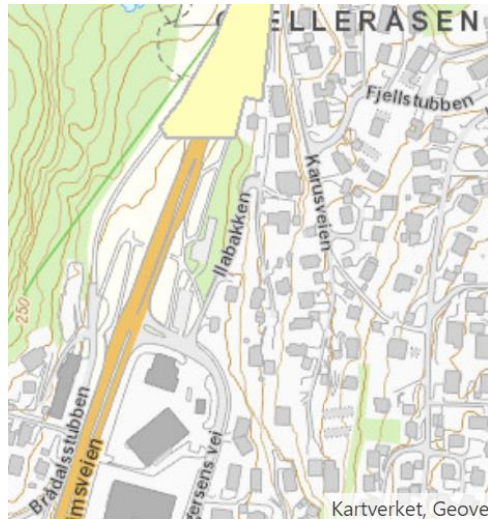
Figur 3. Kartutsnitt forurenset grunn.

Dagens arealbruk kan indikere at det kan avdekkes forurensete masser.