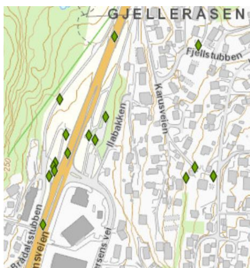
Figur 2. Kartutsnitt av fremmede arter.