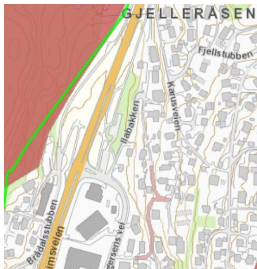
Figur 4. Kartutsnitt av kartlagte friluftsområde (rødt område) og markagrensa (grønn strek)

Verken friluftsområdet eller markagrensa vil bli berørt av tiltaket.