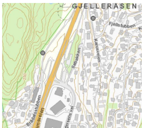
Figur 1. Kartutsnitt av arter med særlig stor forvaltningsinteresse.

I følge naturbase.no er det registrert en alm med særlig stor forvaltningsinteresse. Denne er registrert like vest for dagens gang- og sykkelveg. Denne vil ikke bli berørt av tiltaket.