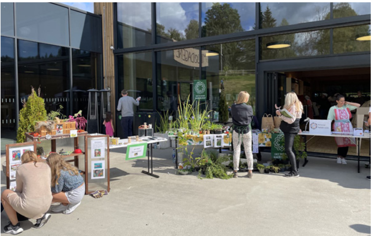
Miljødagene i Nittedal ved Kulturverket Flammen